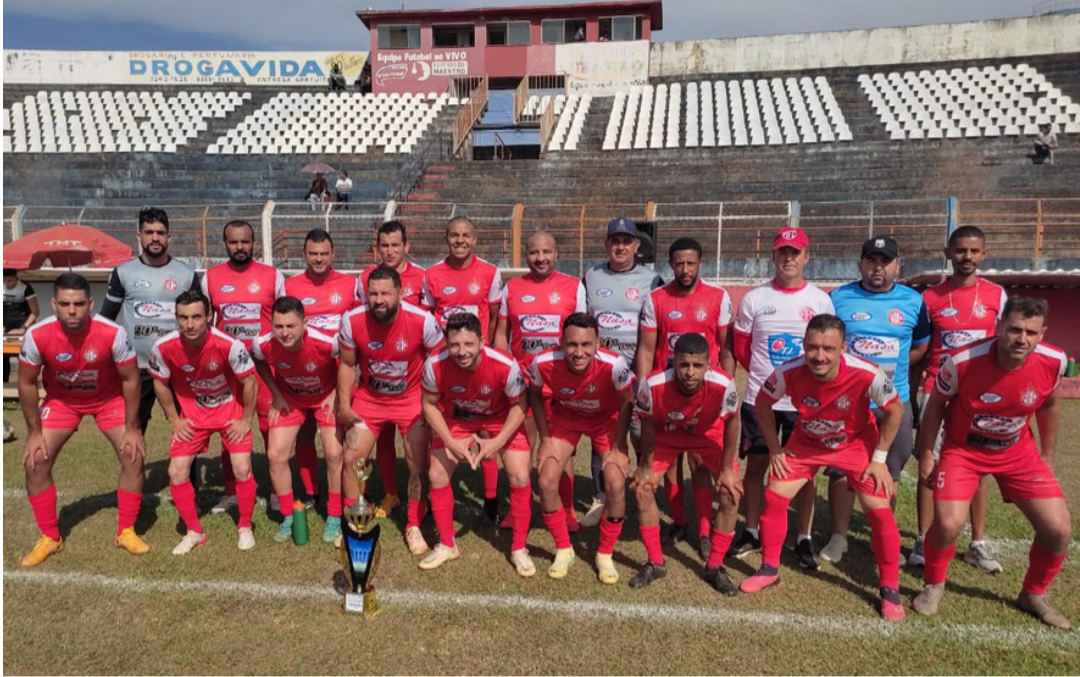
América recebeu o troféu simbólico da Taça Ziza