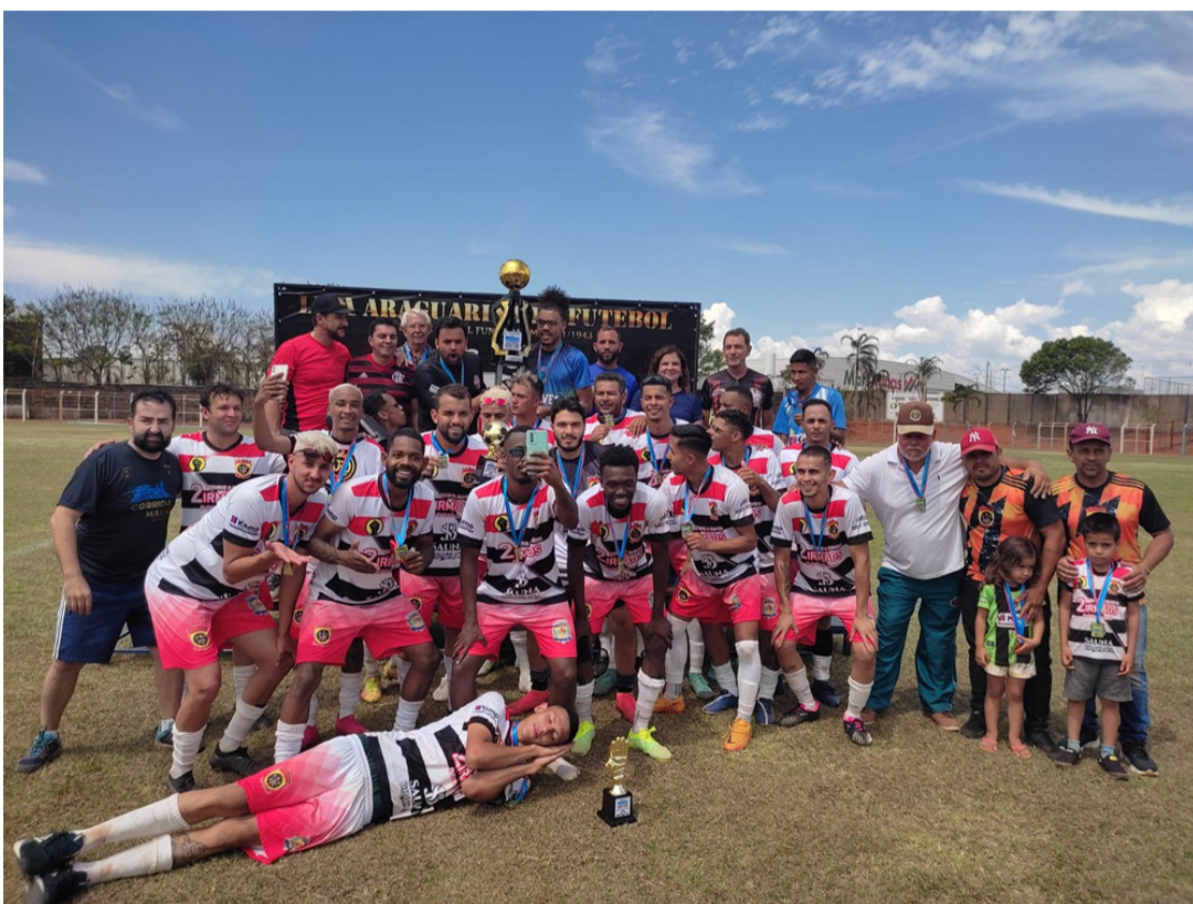
Resgate fez brilhante campanha e ficou com a taça